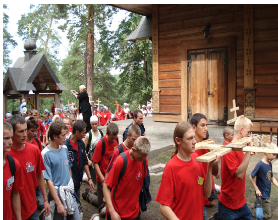
Autorka: Joanna Osypiuk

Pielgrzymka wokół cerkwi szła rozśpiewana. Krzyże poświęciliśmy, wkopaliśmy, I na obiad powędrowaliśmy. Po rozbiciu obozowiska, Noc przemienienia była już bliska. W czasie jej trwania, Nasze bractwo ruszyło na pomoc Matuszkom bez wahania.”