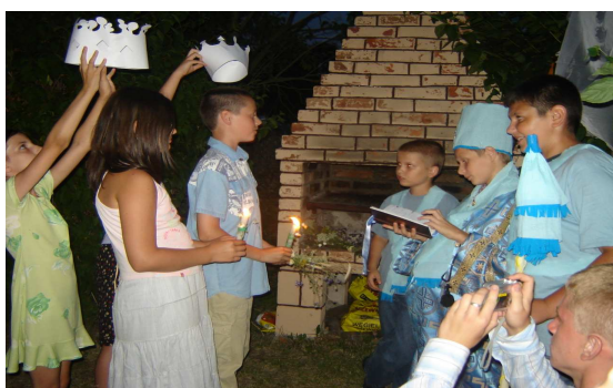
Autorka: Gosia Polikatus, „Śluby”

Niezapomnianym przeżyciem był wieczór, gdy „holeszowski biskup Mateusz” udzielał ślubów parom utworzonym w czasie obozu. Państwo młodzi obiecywali przed „biskupem”, oraz gośćmi weselnymi miłość oraz uczciwość małżeńską.