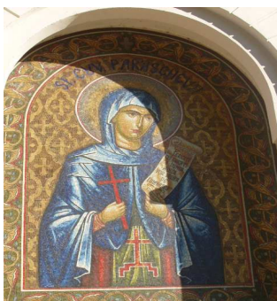
Św. Paraskiewa, cerkiew w Jassach