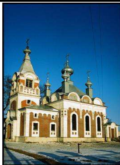
Cerkiew Opieki Matki Bożej w Sławatyczach www.cerkiew.pl

Niech Dni Świąt Bożego Narodzenia będą okazją do zadumy nad tajemnicą Boskiego Wcielenia oraz do dzielenia się Wiarą, Nadzieją i Miłością. Niech radość z oczekiwania i gotowość na przyjęcie Bożego Syna do Waszego życia umocni Duch Święty, który pomoże zasiać ziarno pokoju wśród Bliskich w Nowym 2007 Roku- życzy redakcja